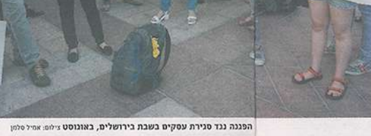
הפגנה נגד סגירת עסקים בשבת בירושלים, באוגוסט 2015.