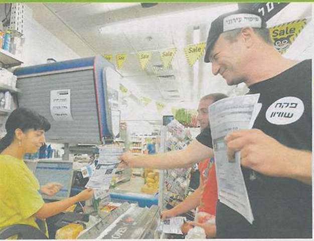
מנחה של הקואליציה לשבת שוויון בתל אביב, בשנה שעברה.

הצורך בהצעת יום מנוחה נוסף, אבל שהוא יהיה חלקי, כדי להגן חשב בצרכים של הקהל הולנדי שמרביתו לא מכיר את המונחים "אלה המועדים לפי היהדות", לא לפי הדת. מצוינים אותם כחשון וככופה דתי, אבל אני לא מתייחס, כי אני שלם עם היהדות שלי, כי אני יהודי גאה."