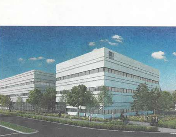
סקסוס האשל בפארק העסקים החכם קיסריה | הרמיה: טריזמיה

"מספרם של חללי ומתחמי עבודה משרד תפים עולה וצומח מתוך ביקוש הולך וגובר בקרב קהילי יעד שגילו את הערך המוסף הג' של האגדיי ענק בינלאומיים. אין לנו שום הגבלה לגודל העסק או היקפו. אנו מעניי' קים ללקוחותינו לא רק שירותים עסקיים עיליים אלא גם את רשת הקשרים ואת קהילה העסקית, על מנת להרחיב את הפעילות, לצמוח ולנצל הזדמנויות עסקיות הנובעות מנטוורקינג. החברה שלה פרישה ארצית מרבה גם לקיים אירועים עסקיים