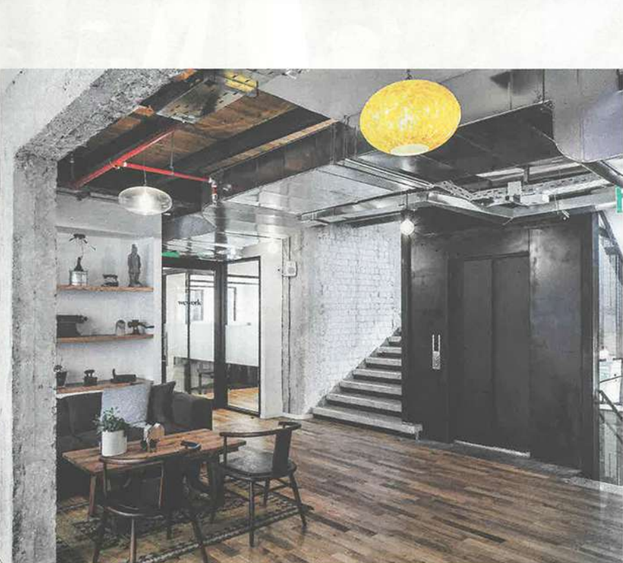
We Work חל אביב | לוזין פקר אדריכלים

השיח בקרב קהילת הטכנולוגיה מדבר על תפוסה מלאה ברחבי הארץ: בין אם מדובר בעמדת עבודה גיילה ובין אם במשרדים משרד תפים המושכרים על בסיס שעתי עד חודשי, הביקוש במגמת עלייה, ועל פי התחזית ימ' השיח לעלות. ישנו מעבר מהמרחב המסורתי למרחבים המודרניים, מעבודה בבתי קפה או בבית להללים נוחים ומקצועיים. הגורמים מהפכה התעסוקתית נובעים בין היתר מאיתנות כלכלת ישראל. בשנים האחרונות חברות התי-טק בישראל ממשכיכות לשגשג ולשמור על תנופה, בד בבד להתעניינות הולכת וגוברת של חברות בינלאומיות כנעשה בישראל, מה שמשך רבות מהן ללב מרכז העי' סקים בישראל, מדינת תל אביב ושלוחותיה, במטרה לבסס סניפים בארץ. גם המהפכות הטכנולוגיות המאפשרות לכל עובד לנהל את עבודתו ממש מכל מקום שיחפוץ, מהוות אחד הגורמים לשינוי בדפוס העבודה.