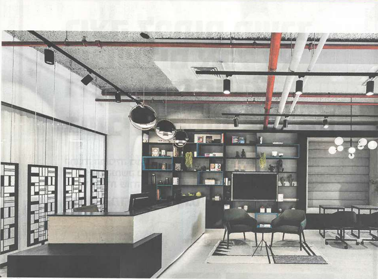
חלל עבודה ריבס, ויזשילס