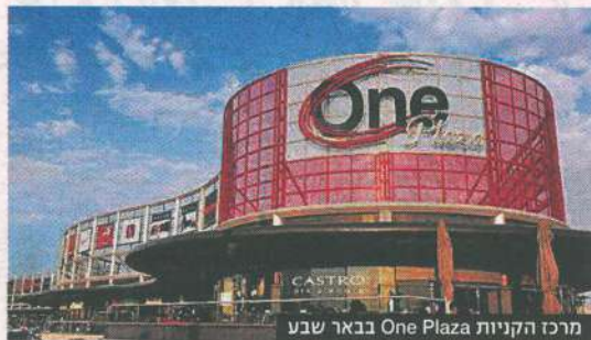
מרכז הקניות One Plaza בבאר שבע

"עתה, בעסקה בבאר שבע, בראשונה התייחס הממונה גם למרכז מסחרי פתוח, כמו ה-One Plaza, ולא רק לקניון סגור, ובמקביל בחן את הפגיעה בתחרות לפי שוק מרכזי המסחר הארצי. הממונה צריך להחליט על קו פעולה אחד ולפעול לפיו, ולא בכל פעם לשנות את הכללים".